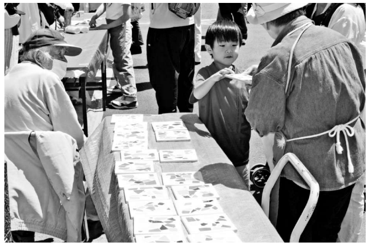
カラフルなモザイクタイルを乾燥させる様子

2026年5月5日、ドパークが碑文谷体育館で開催されました。(火・祝)碑文谷フレンドパークが碑文谷体育館で開催されました。