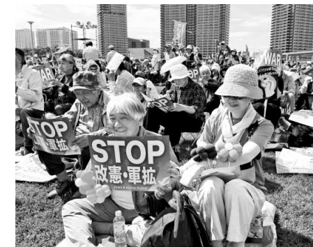
集会でのプラカードアピール

より改悪への危機感を身近に感じている人が多いのか若い世代や家族連れの多さが目立ち、フェスみたいだね」とすれ違ふ人から声が聞かれました。