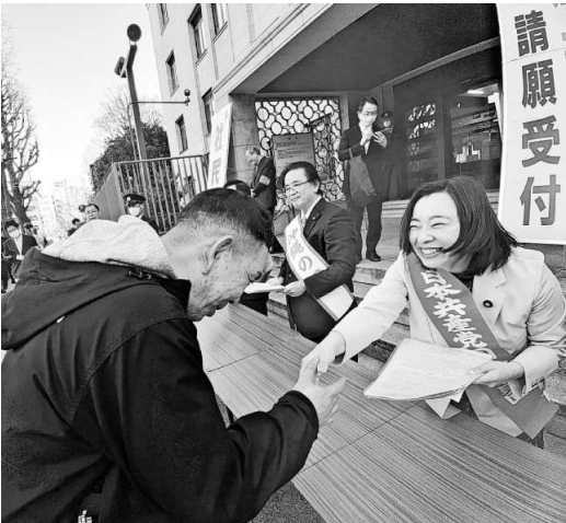
吉良よし子(右) 参議院議員に請願書を渡す齋藤勇太分会長(左)

3月5日(木) 震が関を中心に行われまし。現在、日比谷野外音楽堂は改修工事のため、2000人、支部より