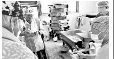
味噌の材料をハンバーグの様にこねる様子

2月21日(土) 萩の会で取り組んでいる大豆畑トラストで、千葉留農薬が増加することになるという怖い話を聞き、私達の食の安全を守り、生物学的多様性を、未来の世代を守るためには、日本でうまれた物を育て食べる