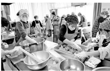
お子さんと一緒に味噌づくり

味噌づくりをする調理室に入っすぐ茹で上がった大豆の良い香りがしました。2月28日(土) 日黒本町社会教育館にて29人が参加し、先生も今回の大豆は良いよーとの事で今回仕込む味噌がどんな味になるのかとても楽しみにしていました。ホクホクの大豆を潰して麹と塩を混ぜたものにこの大豆を混ぜてよく混ぜる、普段スーパーで味噌を買ってしま