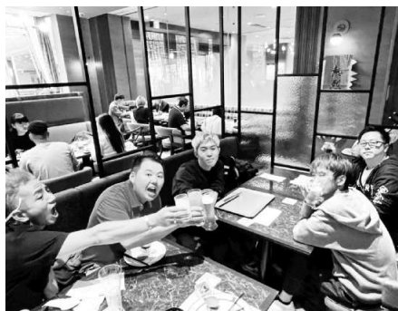
長崎フェアのビュッフェでカンパイ

を6人で行いました。リアル脱出ゲームは、謎ハウス池袋店の最難関である『見えな犬』に挑戦しました。仕掛け