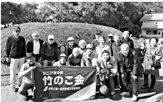
見事な紅葉を背景に集合写真

は河口湖、ここでは紅葉シーズンのピークであまりの賑わいに散り散りとなりましたが、その後の昼食会場には誰一人欠けることなく集合し安心しました。