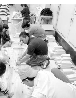
便利イの作り方をレクチャー

11月9日(日)、向原区センターにて、向原組合員8人が参加し、ふれあいまつりが開催された。月向分会から、