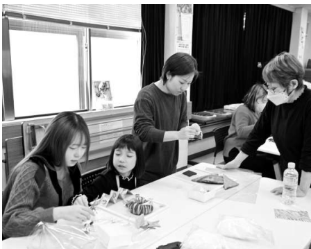
皆で楽しんで作れるリース

に飾りと一緒に貼付けました。色々悩みながら完成させる素敵なリースが出来、帰ると早速自宅に飾っていました。