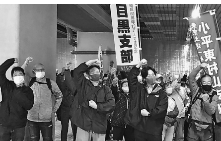
建設国保補助金獲得へ せやろがい