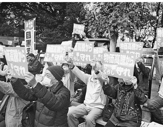
『くらしを守れ』を掲げます