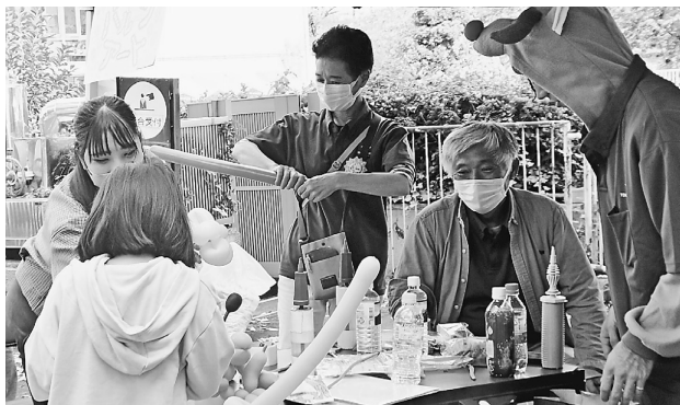
子ども達に大人気、青年部バルーンアート

11月13日(日) 区民センターに於いて目黒支部主婦の会60周年(萩の会)イベント、萩の会フェスタを行い、支部より90人、来場者は500人を超えました。午前中はワークショップ、午後は落合恵子さんの講演と、盛りだくさんの大きなイベントは、萩の会、分会、竹のこ会、青年部に協力してもらいました。実行委員で準備を重ねて来たワークシヨップは、大盛況で大忙しでした。