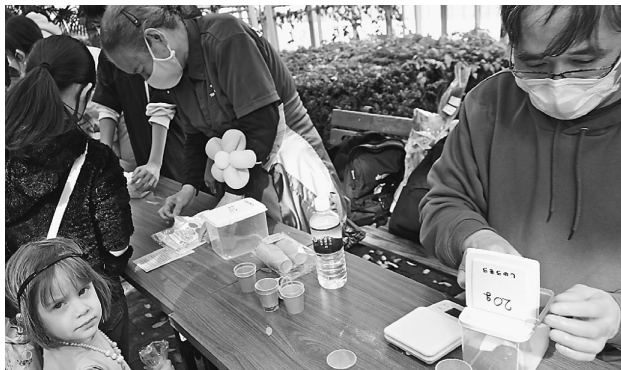
原洗碑分会のバスボムは大行列