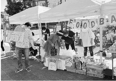
青年部、秋の会で積極的に呼びかけます

お米、レトルト食 品、缶詰等セットにし てお渡しし、今回は、 新鮮トマトとレタスの 提供があり、とても喜 びました。