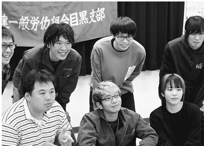
部会での全体撮影の様子

今回の青年部拡大は、5月18日に雨の中、支部の車で拡大グッズとチラシを持って訪問し、青年部会参加への呼びかけ等を行いました。24日に部員宅へ行って直接参加呼びかけ等をし、そのまま部会へ参加してくれました。