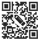
ネット署名QRコード

目黒区はリーマンショック後、待機児童数が多く3年連続ワースト3に入るほど深刻な保育不足があり、国の幼保一体化で私立の保育園が増えました。小規模で園庭のないマンションの1室など保育環境としては不十分なも。区は園児を公園に送迎する「ヒーローバス」をふるさと納税で2台取得するも