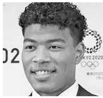
プロバスケットボールの八村塁選手

米プロバスケットボールNBAウィザーズと共同で支援を決めました。八村選手は富山で育ち、海外の女子留学生を支援する活動などに取組む、一般社団法人