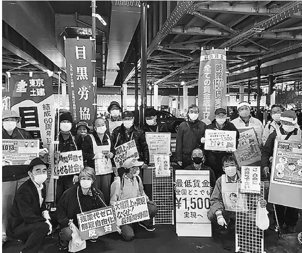
最賃宣伝行動に集まった仲間たち

11月17日中目黒駅で「全国一律最低賃金1500円」を求める宣伝行動を行い全体21人、土建から10人が参加しました。 10月に改定された最低賃金、東京は1013円の据え置きのままです。コロナ禍で貧困格差が浮き彫りになる中、女性が多く占めるパート、アルバイトは非正規労働者の雇止めが増えています。厚労省の集計では、コロナによる解雇や雇止めは7万人以上。8月の労働力調査を見れば、パート、アルバイトは前年同月と比較して74万人も減っている。その多くを占めるのが女性でその数、63万人。シングルマザーの半分以上が貧困。10月の女性の自殺者の割合は前年同月比に比べて82.6%増えている。コロナ禍でこそ、最賃を上げ、貧困をなくしてほしい。もちろん中小企業への支援も一息の持続化では足りない。