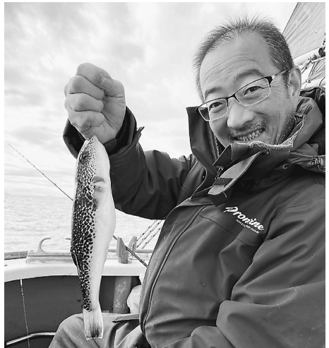
誰がカワハゲやねん(フグです)