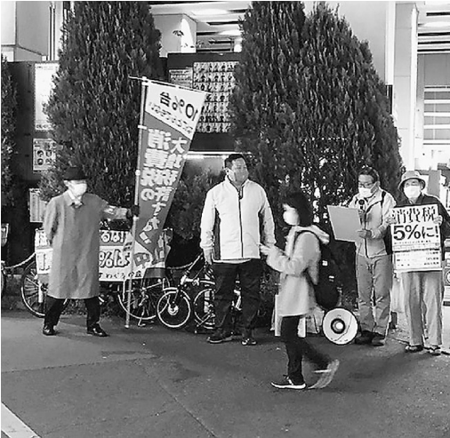
消費税5%にと宣伝する参加者

11月17日中目黒駅で「全国一律最低賃金1500円」を求める宣伝行動を行い全体21人、土建から10人が参加しました。 10月に改定された最低賃金、東京は1013円の据え置きのままです。コロナ禍で貧困格差が浮き彫りになる中、女性が多く占めるパート、アルバイトは非正規労働者の雇止めが増えています。厚労省の集計では、コロナによる解雇や雇止めは7万人以上。8月の労働力調査を見れば、パート、アルバイトは前年同月と比較して74万人も減っている。その多くを占めるのが女性でその数、63万人。シングルマザーの半分以上が貧困。10月の女性の自殺者の割合は前年同月比に比べて82.6%増えている。コロナ禍でこそ、最賃を上げ、貧困をなくしてほしい。もちろん中小企業への支援も一息の持続化では足りない。