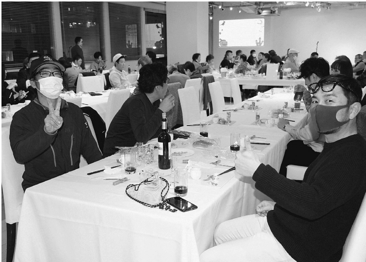
盛り上がったハロウィンパーティー

4月からのコロナ感染拡大による非常事態の中、組合運動を止めず仲間を寄せた活動をするため行われたのは、何より群・分会の基礎組織における役員さんの奮闘があったことです。目黒支部でも各種助成金・給付金相談も100件を超えて相談・申請が行われてきました。春・夏の