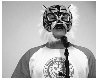
マスク姿の組織部長

取り組みを確信にして、秋の拡大月間をスタートしました。2回のワールドカフェでは、参加者から「大変なときこそ、訪問・対話で仲間と繋がり、孤立を防ぎたい」「仲間からの感謝で、自分も力をもらえる」と多くの仲間が、この厳しい状況でこそ「仲間を寄せよう」という、想いを共有することが出来ました。10月11日の中間決起集会では、最速スピードで全分会月間目標を達成し、打ち上げまで奮闘することを誓い合いました。30日のハロウィン打ち上げパーティーでは60人の参加があり、加入書42枚の持ち寄り、最終加入人数164人で倍拡大を達成することができました。