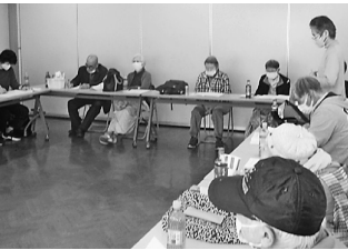
柿の木八雲分会総会の様子

補聴器購入の助成制度を求めた陳情は、11月区議会「継続審査」となり、2月27日開催された区議会生活福祉委員会において再審査の結果、 共産党・新風の会派が採択、自民・公明・フォーラム目黒(立憲・無所属、前回採択を主張)が継続審査を表明し同数となり、委員長の自民党の判断で「閉会中継続審