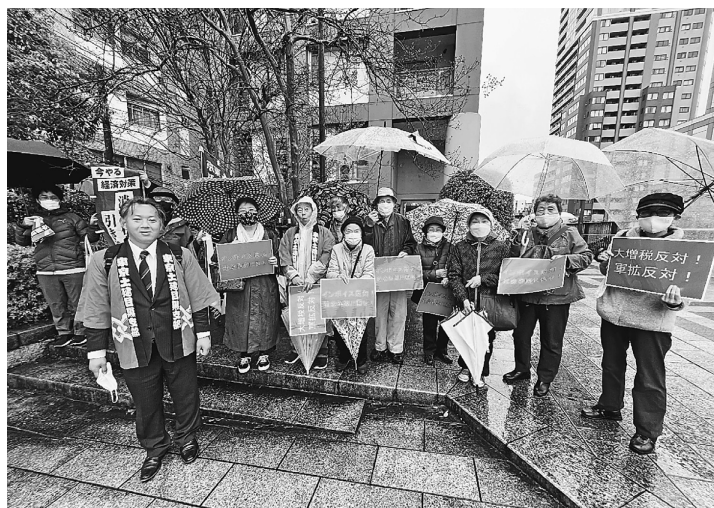
傘を差しながらの目黒新橋お花見宣伝

3月26日(日) 目黒新橋でお花見宣伝をやりました。インボイス反対マイナンバー保険証反対軍拡反対等訴えました。生憎の雨でティッシュ配りもできず、短時間の訴えになってしまいました。