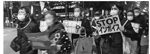
発光するアクセサリを各々身に纏い夜間の行進をします

要求実現アクション 2023「もう黙ってはいられない!!生活危機突破3・28決起集会」に参加し、日比谷公園に千人が参加しました。昨今の物価高の影響を受け、世間では弁当がのり弁になった。との声も聞こえて来ます。共産党の山添拓氏は「政府は『二重課税にあたる』として大企業の内部留保への