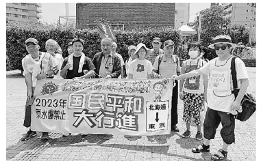
中目黒府入場での引き継ぎの様子

2023年原水爆禁止国民平和行進が5月6日、東京・夢の島第五福竜丸展示館前からスタートしました。西部コースは7月27日(木)世田谷区の若林公園から出発し、お昼前には中目黒府入場公園に到着、36℃を超