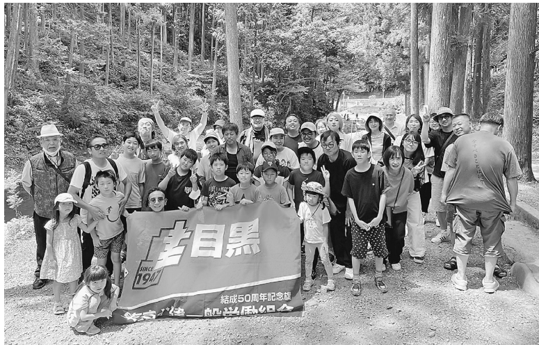
組織部も総出の39人

8月6日(日)、後継者「トライブ」でサクプレとしてコロナ前に大好評だった秋川マス釣り国際渓谷でバーベキューを行ってまきました。 サクプレとはサクセサープレイ「後継者の遊び」という意味です。若者に組合の行事はかっこいいことをし