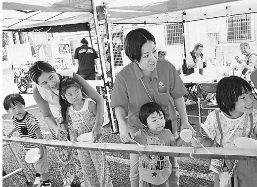
そうめんを待つ親子

「SDGsのポスターの前で水を汚さない努力は、環境を守ります」という説明にへん、と