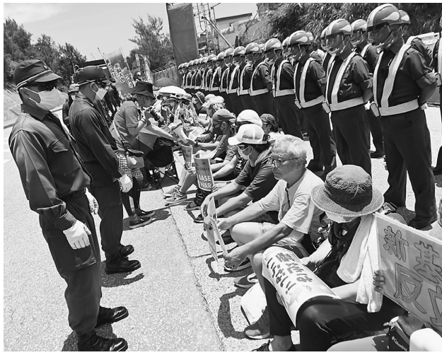
土砂投入を一秒でも遅らせる為座り込む仲間