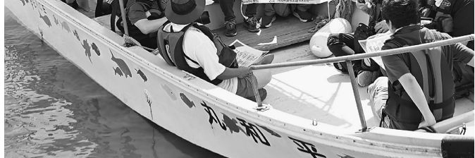
平和丸に乗船し、海上から視察、抗議