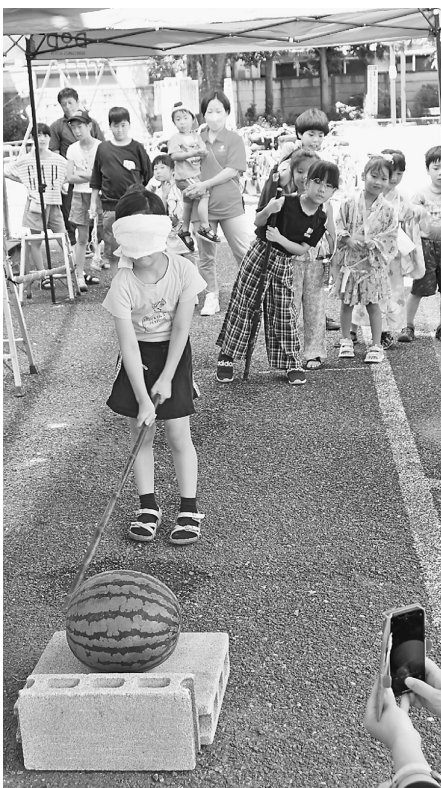
行列が出来たスイカ割