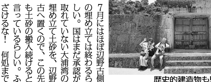
歴史的建造物も見学