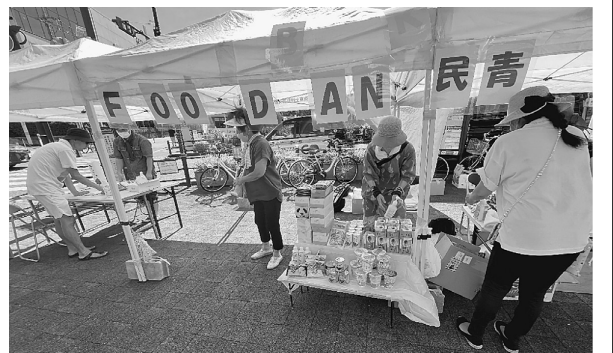
萩の会や地域団体が中心となり準備します

などを受け取る「ありがたい」とございます。萩の会のKさんは「熱いけど思いの他沢山の人が受け取りに来た。多くの方が困窮して困っているんだよ」と話します。食料を受け取った女性性は「生活が厳しいので本当にありがたい。子どもが3人いる。学費や生活費が大変」と話しました。 まだまだ周知には至っておりませんがこのような方々のために続けることは大切です。次回8月27日(日)15時から、大岡山駅前でお待ちしております。 A・O