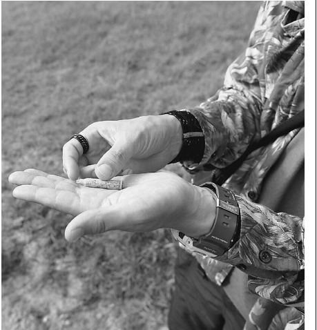
高江ヘリパッドや訓練場付近は薬莖がいくつも転がっている