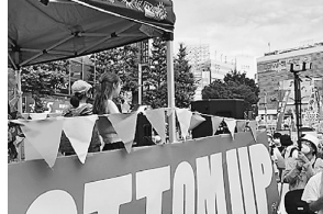
色鮮やかなサウンドカー(エキタス)

打開するには、最低賃金を上げて憲法に保障された文化的で最低限度の生活を送れるよう