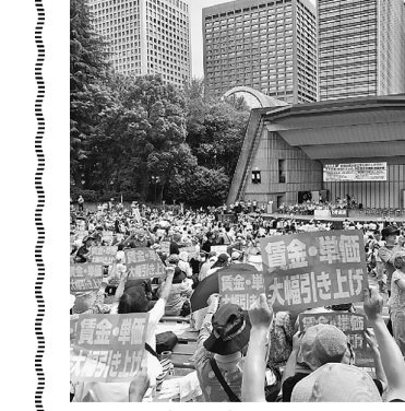
2000人の仲間で埋まる野外音楽堂

最後のパレードは危険な暑さの為、勇気あふれる撤退をした参加者の方々の分まで頑張って歩いて来ました。