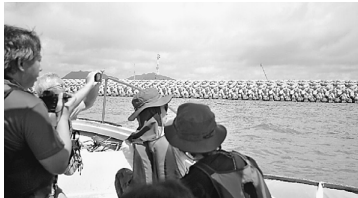
辺野古の護岸、現在約8mの高さに(昨年5m)