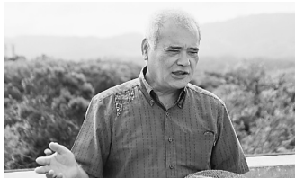
やんばるの森を背に高江の現状を語る伊佐真次議員

2023沖縄平和ツアを6月29日〜7月1日に開催し、辺野古新基地建設の現状視察と沖縄で闘っている仲間を応援するために組合員、他支部、地域から23人が参加しました。一日目は沖縄北部やんばるの高江に行きました。自然豊かなやんばるの森は国立公園に