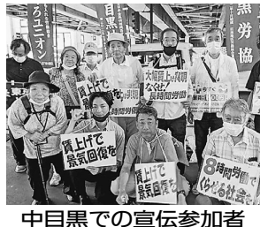
中目黒での宣伝参加者

れる印象です。新宿の街を歩く若者の多くが低賃金にあえぐ同じ境遇の私たちの叫びを自分事として受け止めていないからではないでしょうか。アンケートで最賃が1500円になったら、したい事に「病院にかかりたい」「本を買いたい」とかさやかな願いが寄せられました。飛び入り参加も含めて500人が熱いコールのデモを行いました。