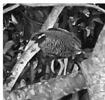
宿の外にいたヤンバルクイナ