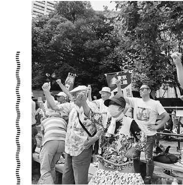
声をあげる支部の仲間

のヤモリに会えたり、夜出かけた星空ツアーではムラサキオオヤドカリ会えたり、ホテルの前の木にヤンバルクイナがいてなかなか逃げなくて、木の上で貴婦人の様に歩いて見せてくれました。感動!!