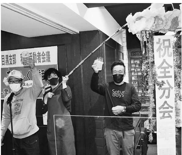
乾杯の音頭をとる学芸大分会