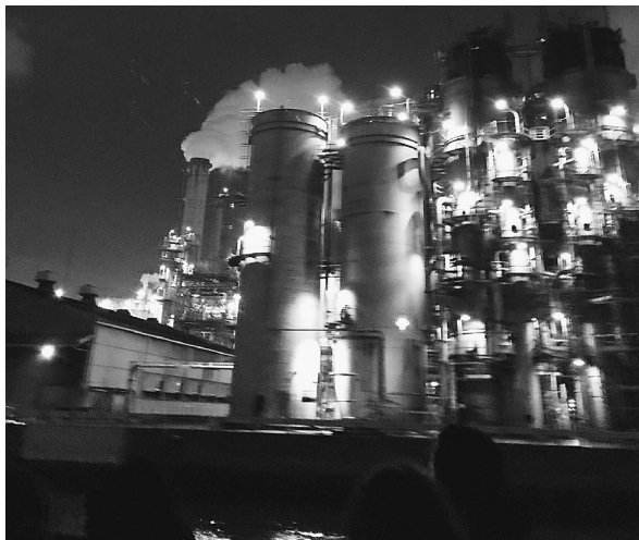
幻想的なフレアスタック

10月31日(日)に青年部で横浜工場夜景クルーズに行きました。ハロウィンの日でもあったため、道端でコスプレしてパフォーマンしている人もいて乗船の前から楽しかったです。いざ乗ってみると風が冷たかったものの、工場の夜景やフレアスタックが美しく大変印象深い経験となりました。クルーズ後にはそのまま飲みに行き交流を深めました。コロナが少し収まってきてイベント等の活動ができるようになってうれしい限りです。このまま年明けのスキースノボレクも大いに楽しんでいきたいと思っております。 青年部四役