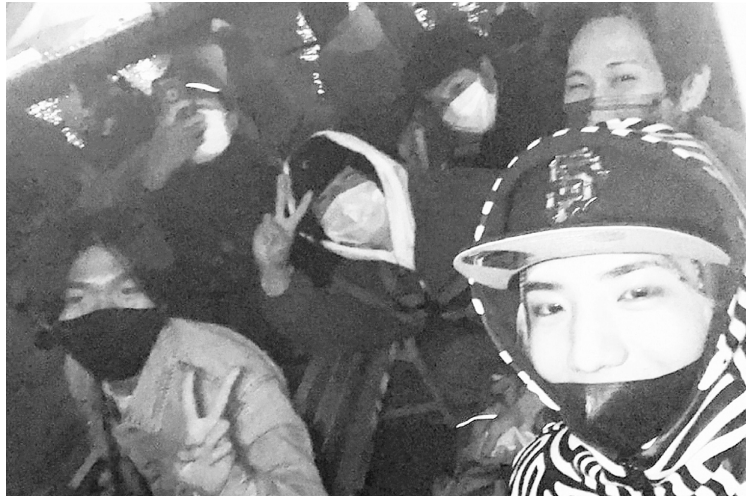
今期初の外でのイベントに盛り上がる青年部

10月31日(日)に青年部で横浜工場夜景クルーズに行きました。ハロウィンの日でもあったため、道端でコスプレしてパフォーマンしている人もいて乗船の前から楽しかったです。いざ乗ってみると風が冷たかったものの、工場の夜景やフレアスタックが美しく大変印象深い経験となりました。クルーズ後にはそのまま飲みに行き交流を深めました。コロナが少し収まってきてイベント等の活動ができるようになってうれしい限りです。このまま年明けのスキースノボレクも大いに楽しんでいきたいと思っております。 青年部四役