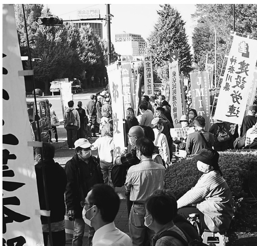
総選挙結果を受けて大勢集った国会正門前

11月3日(水・祝)国会正門前で「平和と命と人権を！」などを掲げて憲法大行動が取り組まれました。参加・視聴者共に2000人(主催者発表)東京十建全体で75人、支部より4人が参加しました。総選挙結果を受けて集まった野党の代表達か