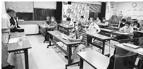
制限人数ギリギリまで集まった参加者